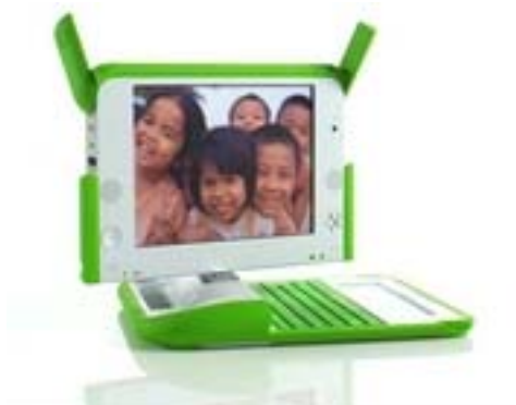
Figura 1b.- Vista general de una OLPC.