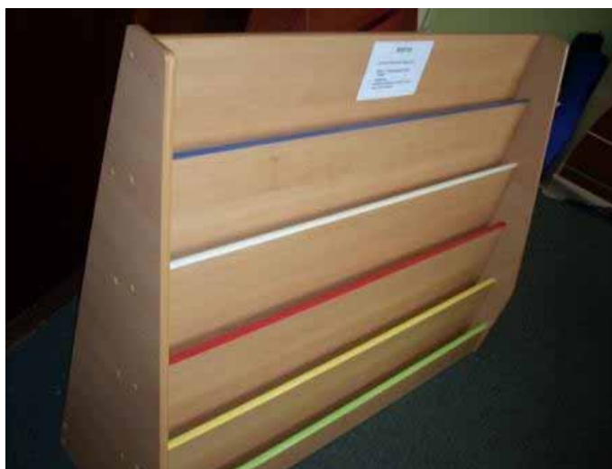
Imagen del mueble

El mueble se encuentra cubierto por los cuatro lados con cartón de doble corrugado, fijado y protegido con film plástico. Para evitar daños del rigidizante colocado en la parte baja posterior, se han embalado de a dos (uno de pie y el otro de cabeza formando un rectángulo) y a su vez los dos muebles están recubiertos con film plástico.