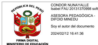
ISABEL CONDOR NUNAYALLE Asesora Pedagógica de la DIFOID