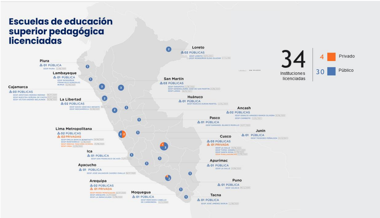
Distribución territorial de los Institutos de Educación Superior Pedagógica y Escuelas de Educación Superior Pedagógica