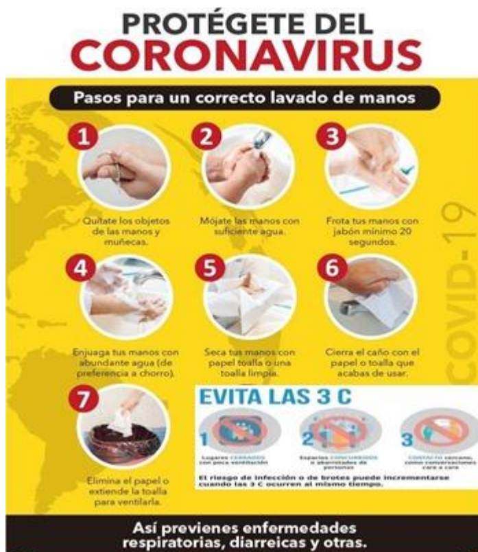
Figura 4. Lavado de manos