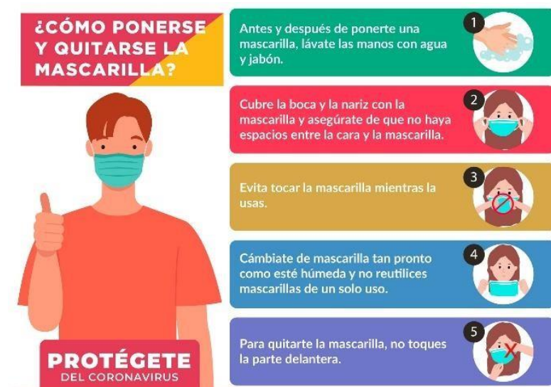
Figura 2. Uso correcto de la mascarilla