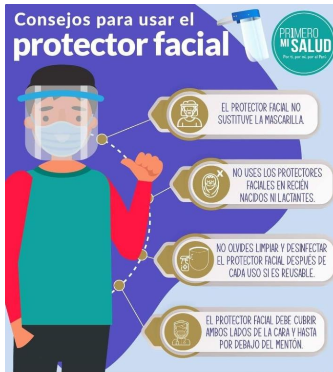
Figura 3. Uso correcto del protector facial