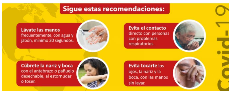
Figura 5. Recomendaciones generales preventivas