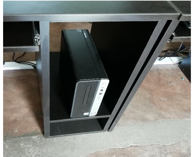
Unidad Central de proceso - CPU