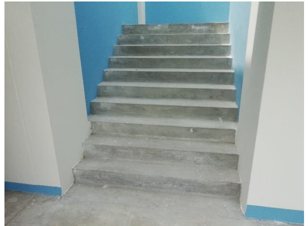
Acondicionamiento de escalera