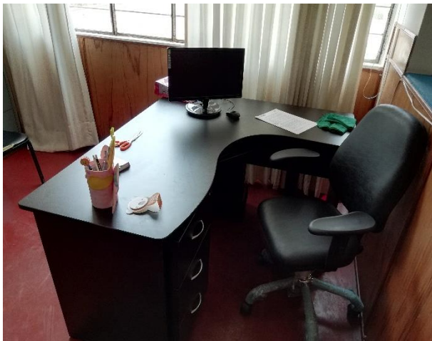
Escritorio y silla