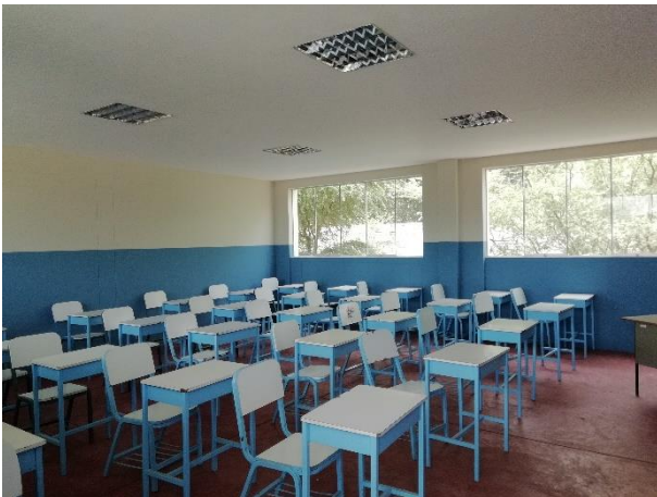
Acondicionamiento de aulas