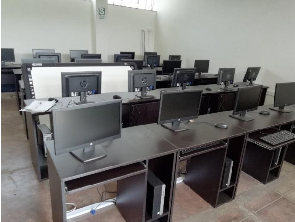
Módulos para computadoras