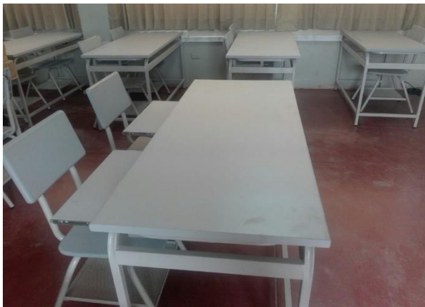
Mesas y sillas