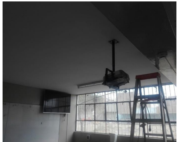
Televisor y Proyector