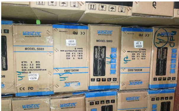
Unidad Central de proceso – CPU