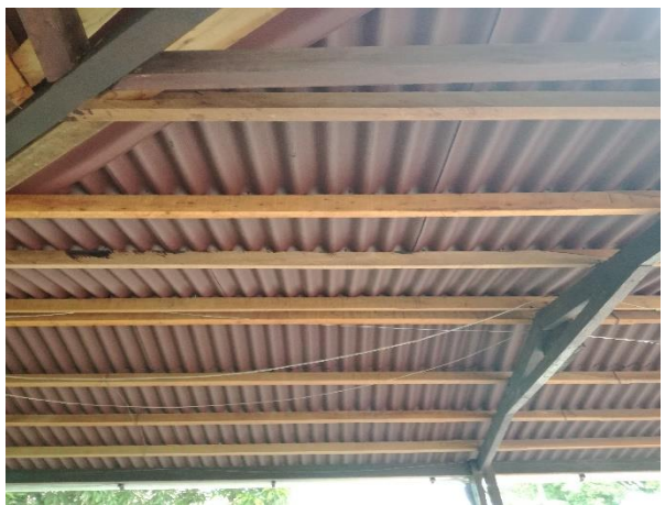
Instalación cobertura termo cáustica