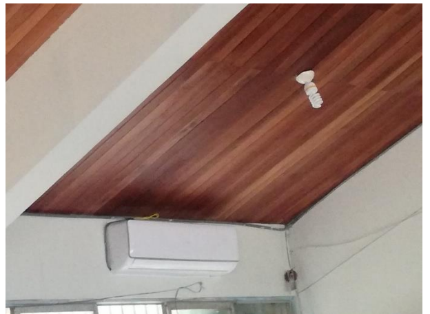
Reparación aire acondicionado