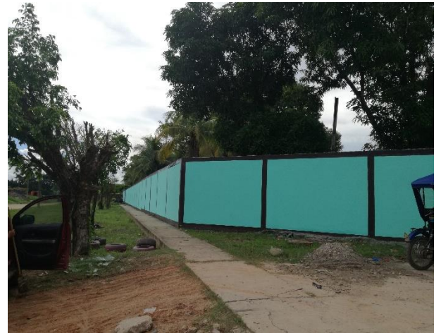
Mejoramiento cerco perimétrico