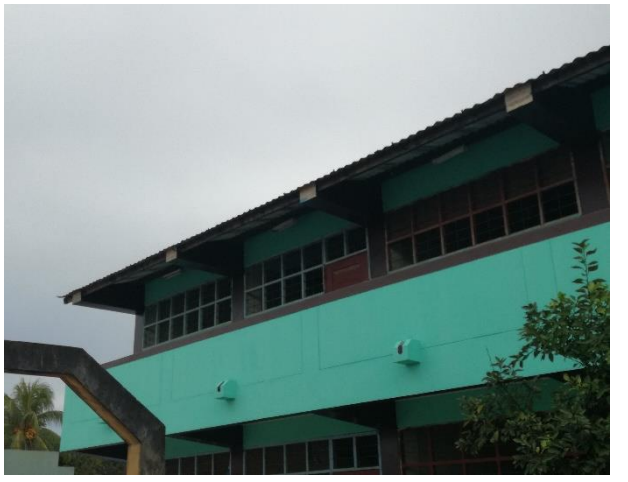
Pintado del Instituto