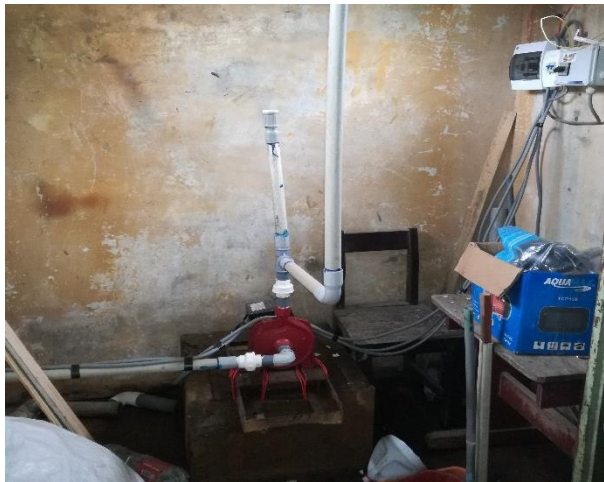
Distribución del agua potable