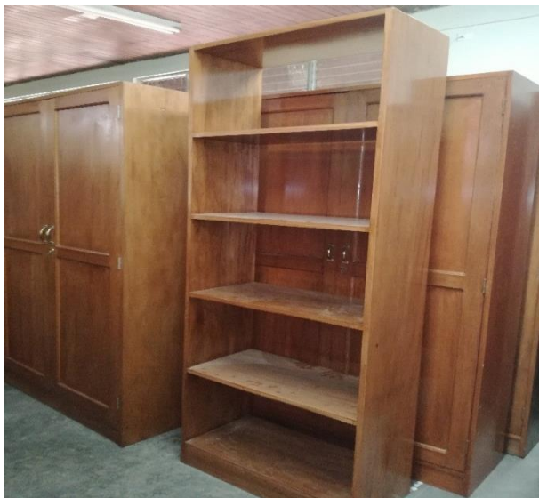
Estante y armario de madera