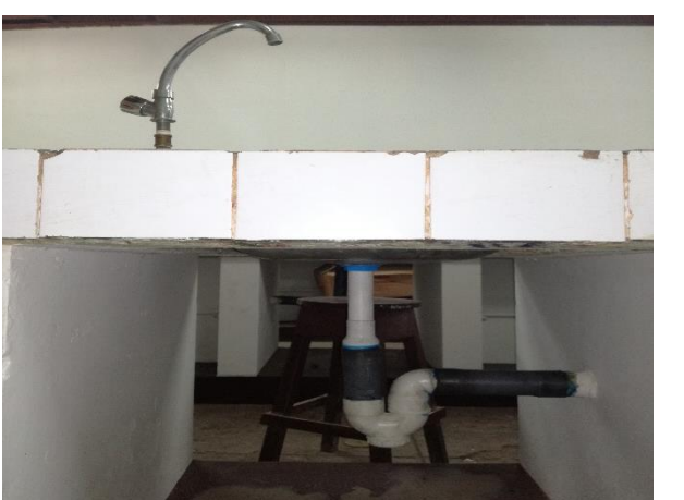
Reparación de los tubos