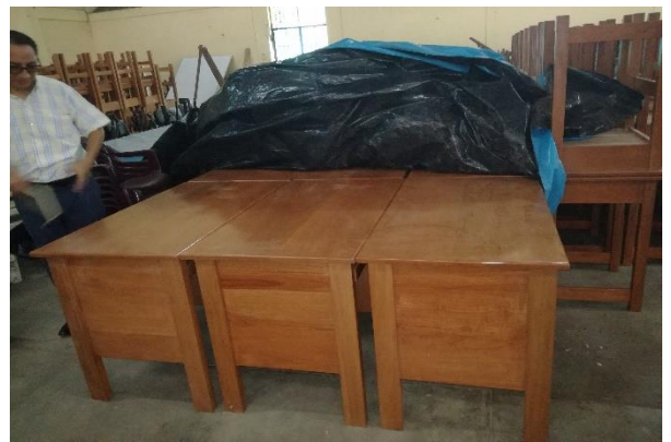
Escritorios de madera