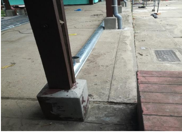
Instalación de canaletas

"Decenio de la Igualdad de Oportunidades para Mujeres y Hombres" "Año del Diálogo y la Reconciliación Nacional"