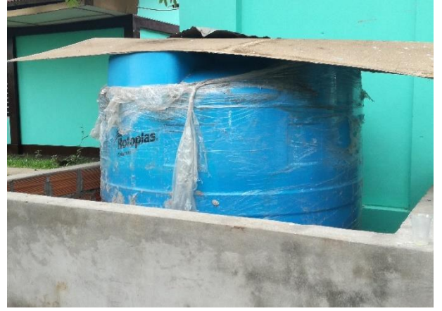
Instalación de tanque de agua