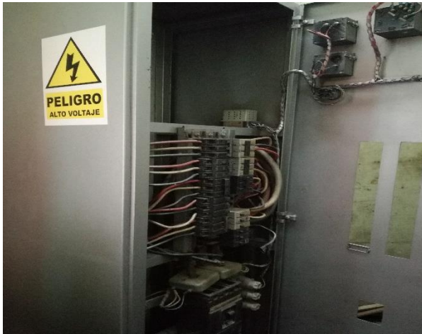
Mantenimiento Sistema Eléctrico