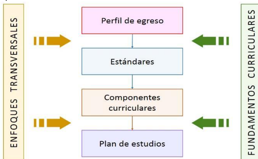
Figura 2. Esquema del Modelo curricular de la Formación Inicial Docente

El modelo curricular responde a una concepción sistémica que articula las políticas y objetivos establecidos para el sector Educación. Considera las demandas del Currículo Nacional de la Educación Básica, del Marco de Buen Desempeño Docente, así como del Proyecto Educativo Nacional. Por ello, sustenta las decisiones tomadas en la elaboración, organización y articulación de los elementos del DCBN, y comunica cuáles son los puntos de partida, cómo se relacionan sus elementos y cuál es su énfasis en la formación de estudiantes de FID.