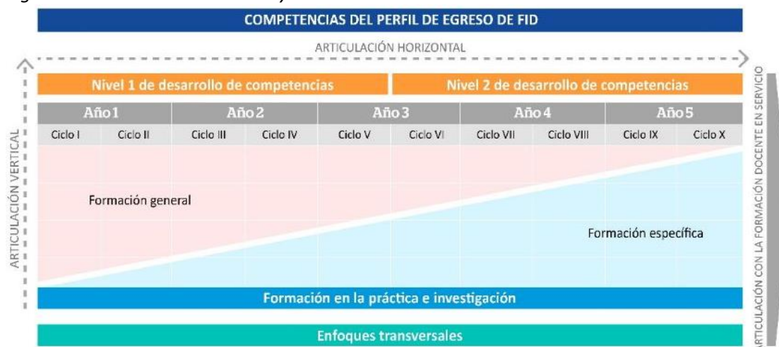
Figura 4. Articulación horizontal y vertical del DCBN de Formación Inicial Docente

la coherencia entre los distintos componentes del currículo, se proponen dos tipos de articulación: i) la horizontal y ii) la vertical.