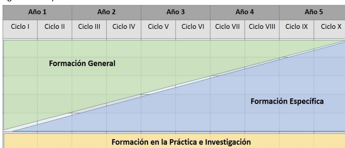
Figura 3. Componentes curriculares de la Formación Inicial Docente

Esta forma de organización contribuye a la formación integral del estudiante de FID desde una visión sistémica y coherente donde ya no se trabajan contenidos atomizados, sino que se promueve el desarrollo sinérgico de las competencias profesionales docentes del Perfil de egreso.