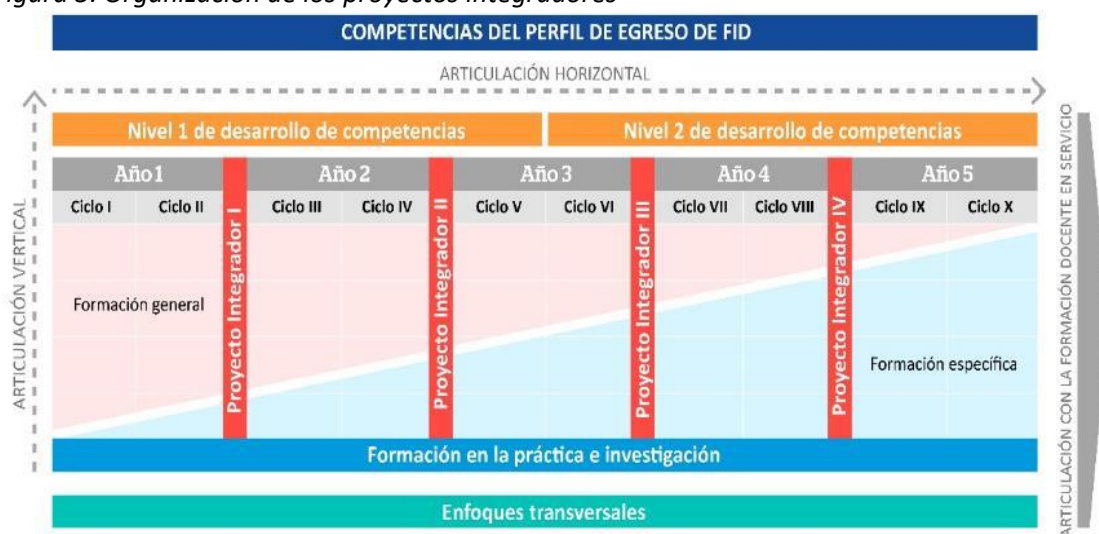
Figura 5. Organización de los proyectos integradores