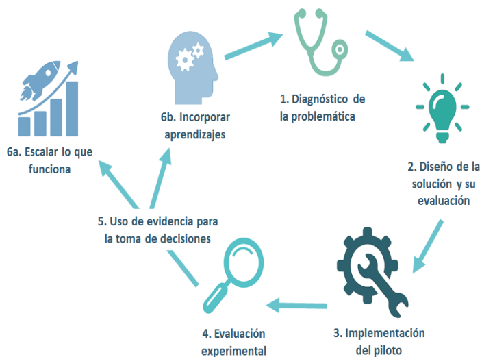
Figura 3. Ciclo de Innovación MineduLAB

MineduLAB es un laboratorio de innovación costo-efectiva para la política educativa que trabaja en la identificación de innovaciones de bajo costo que pueden ser piloteadas y evaluadas recurriendo a data administrativa existente, permitiendo así la innovación y el aprendizaje continuo en la política educativa. MineduLAB es una herramienta gestionada por la Oficina de Seguimiento y Evaluación Estratégica (OSEE) que forma parte de la Secretaría de Planificación Estratégica (SPE). www.minedu.gob.pe/minedulab