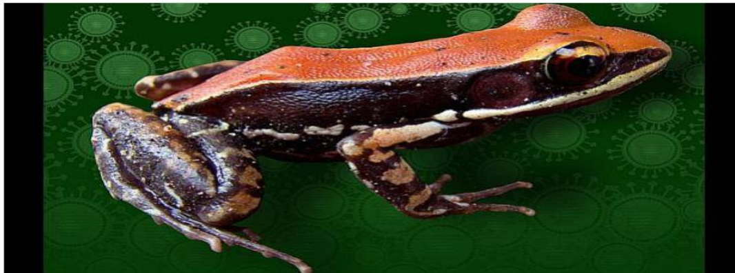
La rana 'Hydrophylax bahuvistara' se encuentra en el sur de la India.

Compartir 6 Twitter +1 0 Compartir 0 Print 0 0 Print