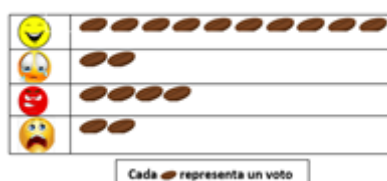
Nuestras emociones en el primer grado