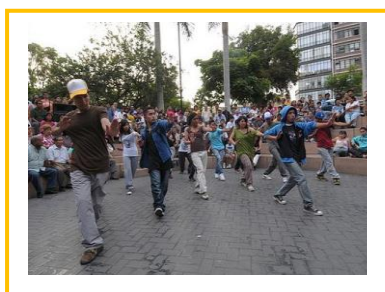
Danza urbana en la calle (Lima).