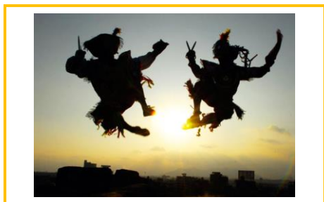
Danza de tijeras (Perú).