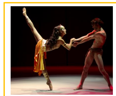
Ballet Nacional (Gran Teatro Nacional).