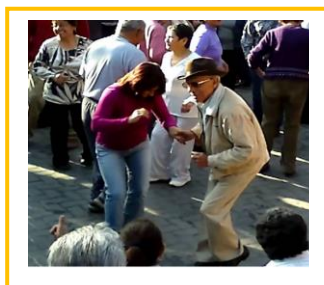
Salsa en el parque.