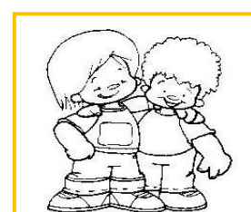
Niños como buenos amigos.