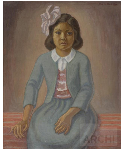
Retrato de niña (1942), de Camilo Blas (Perú). MALI.