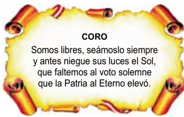
Himno Nacional del Perú