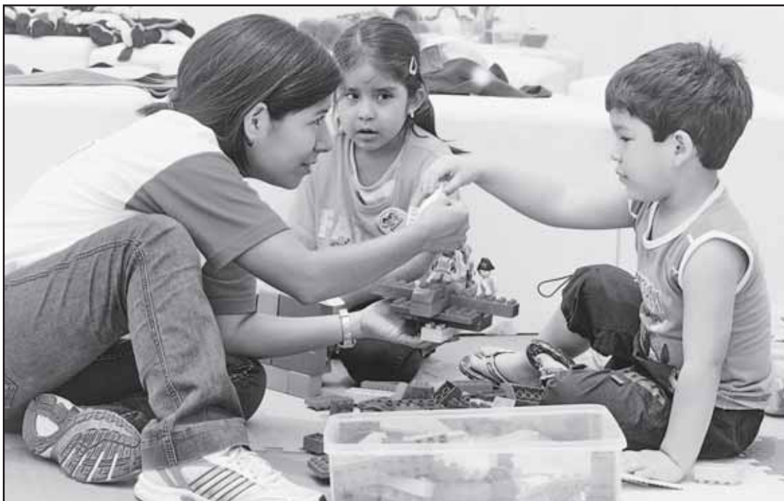
Nuevo comienzo. El objetivo es hacer del colegio un lugar digno y productivo para nuestros escolares.

El gran cambio para la educación peruana comenzó cuando se aprobó el mayor incremento del Presupuesto Público para este sector: 15.6% más respecto a lo que se otorgó en 2011. Esto ha permitido que el Ministerio de Educación inicie una serie de medidas que favorecerán a los escolares, sobre todo de las zonas rurales del país. Se ha avanzado en muchos aspectos, pero el camino aún es largo para lograr la escuela que todos queremos.