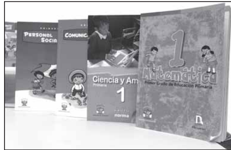
Textos a tiempo. Minedu ha prometido que los libros llegarán a tiempo.

Pero el Estado, a lo largo de los últimos ocho meses, también ha tomado medidas que beneficiarán a los escolares de las zonas rurales y de extrema pobreza. Se ha dispuesto que, desde el inicio de clases, los alumnos de los colegios que están en zonas de extrema pobreza o muy pobres recibirán desayuno y almuerzo. El Minedu y el Ministerio de Desarrollo e Inclusión Social (Midis) trabajan para cumplir esta tarea necesaria.