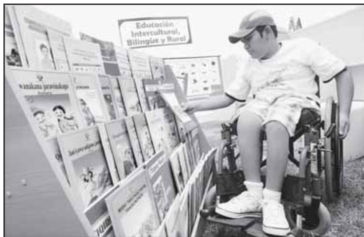
Incluidos. Escolares con discapacidad y de zonas rurales son prioridad.

Comas y son estudiantes de colegios nacionales, y el último viernes pudieron conocer los materiales que desde el 1 de marzo estarán a su disposición en sus colegios. Esa es la promesa del Minedu: hacer que este inicio de año escolar sea diferente y mejor. Que cuando lleguen los alumnos a sus aulas encuentren a su profesor listo para empezar a impartir enseñanzas. Encontrar un plantel digno, seguro y limpio. Y, lo más importante, tener