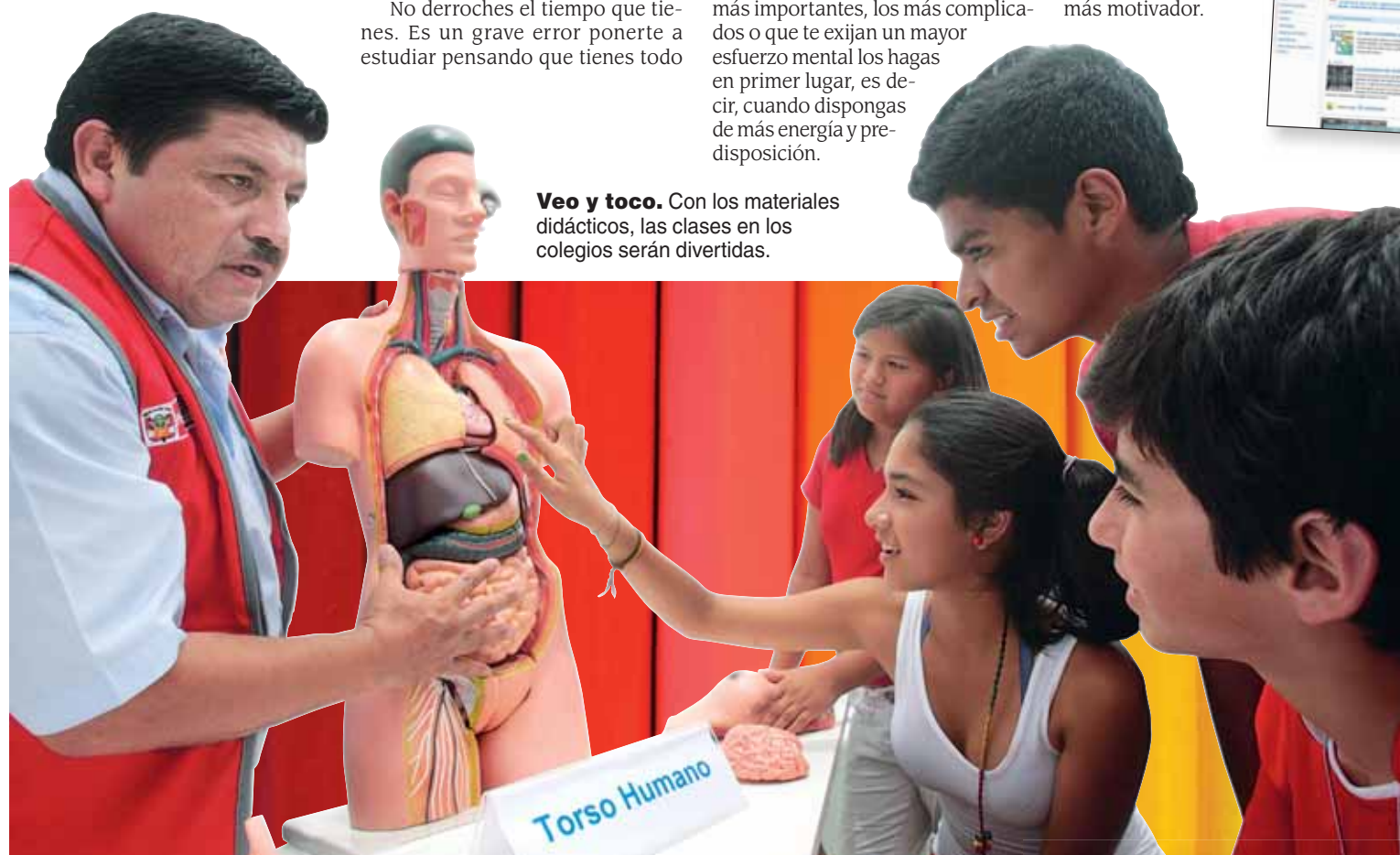
Veo y toco. Con los materiales didácticos, las clases en los colegios serán divertidas.

En la web de la Biblioteca Digital Mundial (WDL) de la Unesco donde se muestran las reliquias culturales de todas las bibliotecas del planeta.