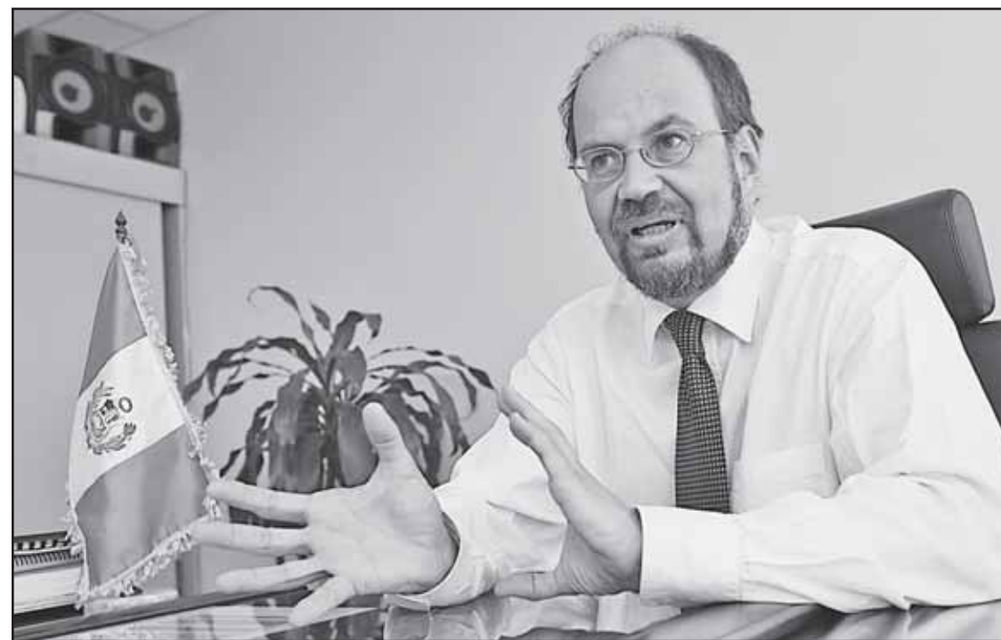
Acuerdos. Con 25 gobiernos regionales se firmaron pactos por la educación, informó Vegas.

—Así es, porque en una política de inclusión social hay que atender a estos sectores que estuvieron marginados, discriminados y recibieron